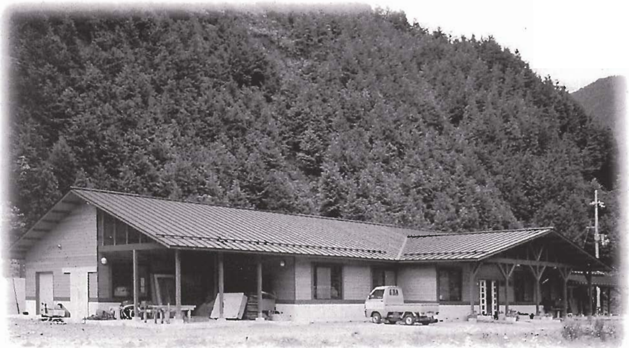
加美町立杉原紙研究所