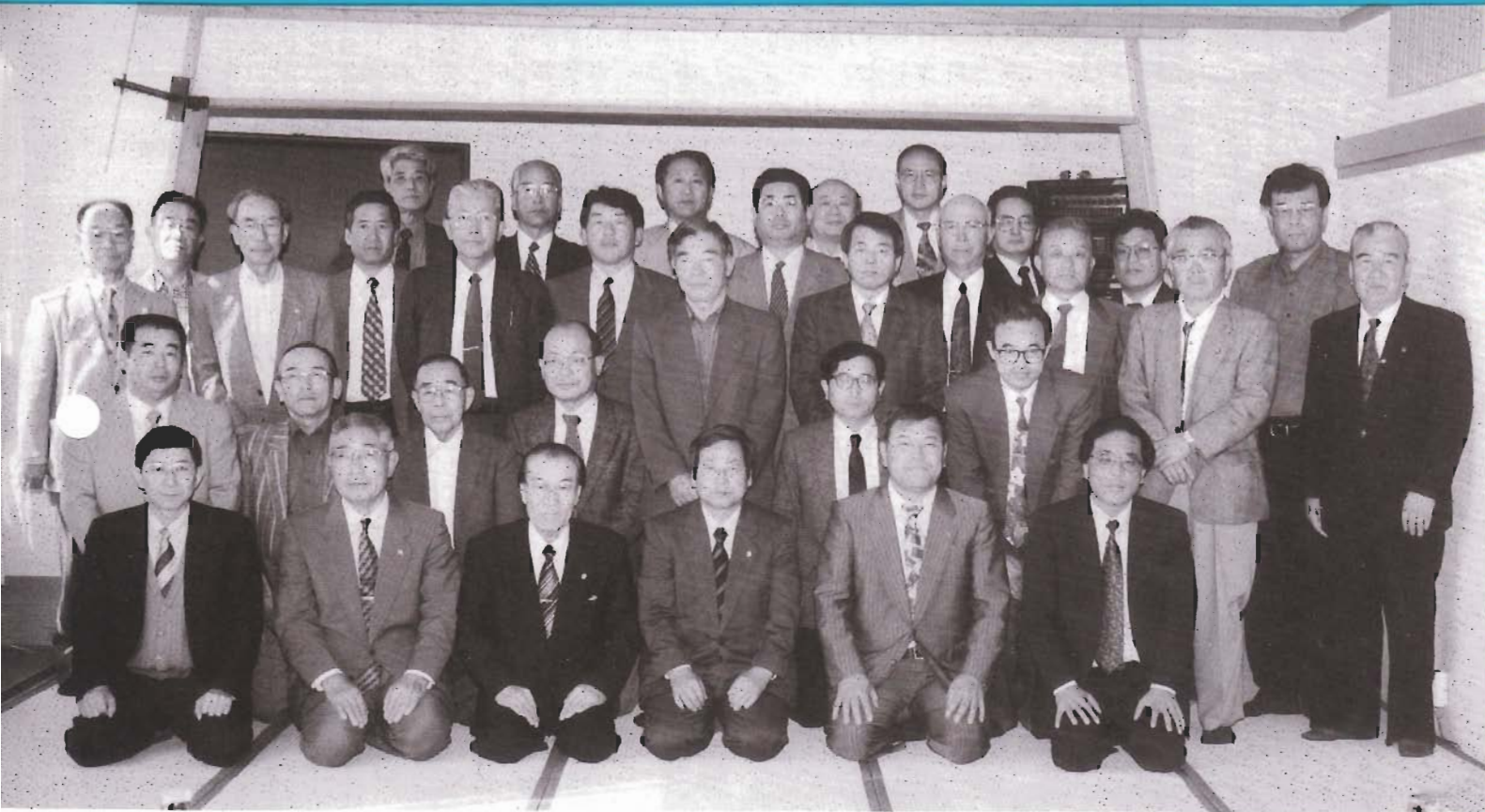
東播支部第37回定時総会に於て