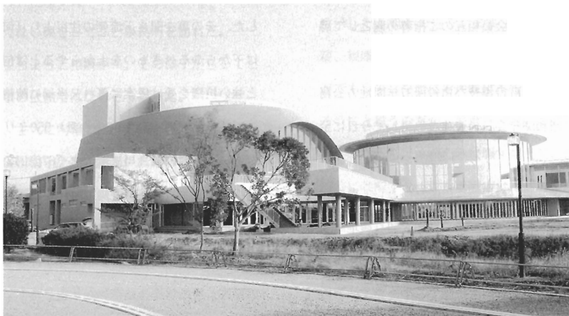
小野市うらおい交流館（エクラ）（平成17年3月20日グランドオープン）