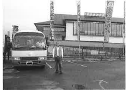
キャンピングカーと共に