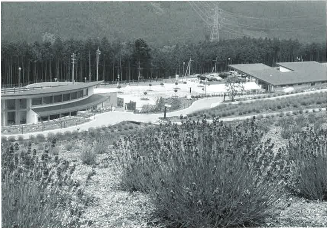
ラベンダーパーク多可（多可町加美区轟）