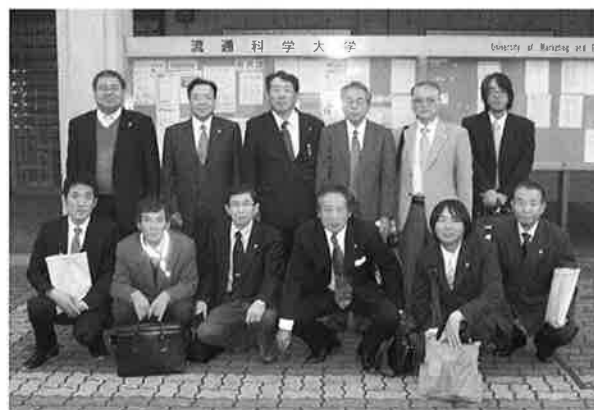
流通科学大学にて（神戸市西区）

開業して間もない私にとって、東播支部の先生方や他支部の先生方と出会い協力できたことはとてもいい経験になりましたし、この日一日で色々なことを感じ、学びました。相手の立場に立って考えることや、事前準備の大切さはどの仕事にも共通する基本的なことだと思いますが、これからも日々の経験から学び続ける姿勢を持って仕事に取り組んでいきたいと思いました。