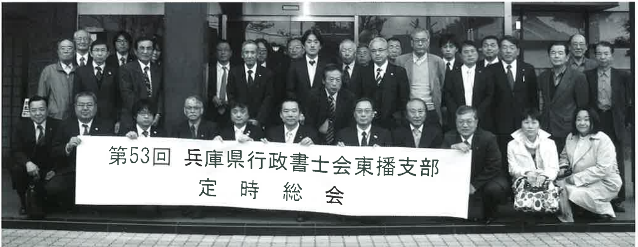
第53回 東播支部定時総会（平成25年4月20日 滝寺荘にて）